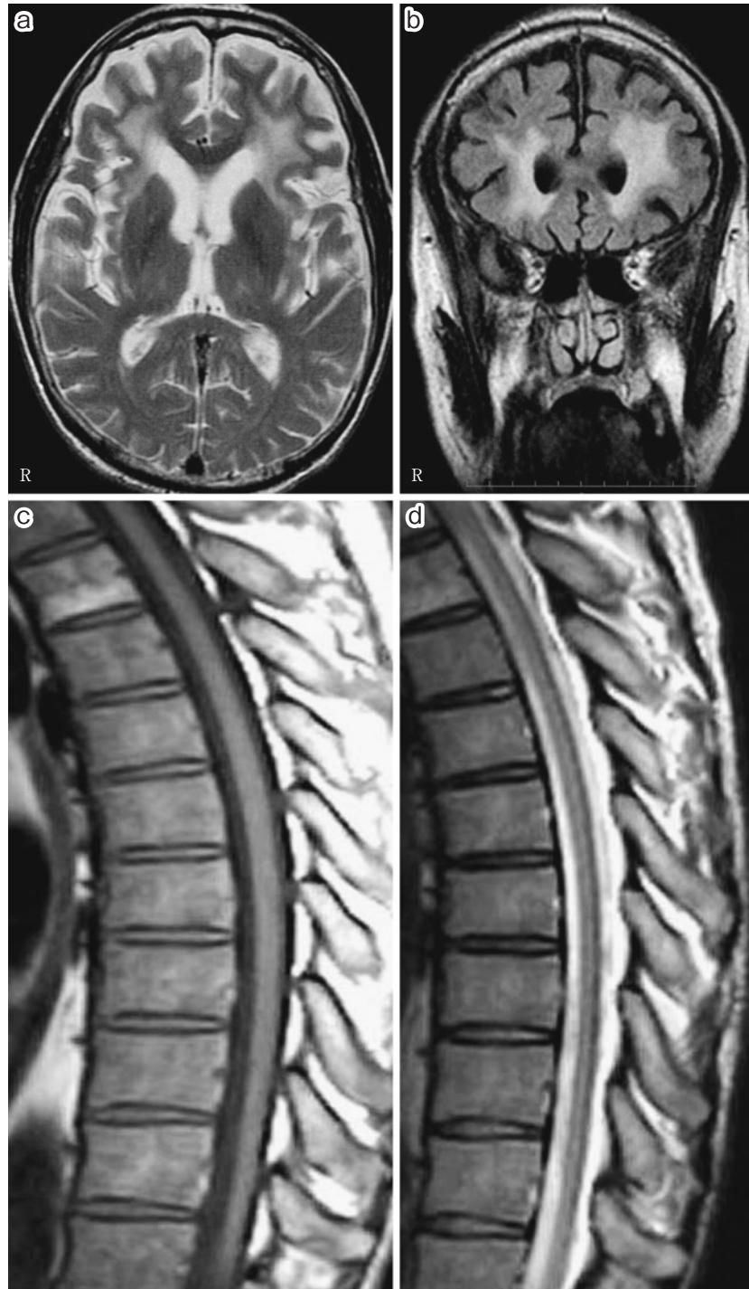
Fig. 1 Brain MRI. Axial T 2 -weighted image (a; 1.5T, TR 3,100ms/TE 119.0ms) and Coronal fluid attenuated inversion recovery (FLAIR) image (b; 1.5T, TR 11,002ms/TE 82.5ms) show high intensity areas in the deep white matter dominantly in the frontal lobes. T 1 -weighted image (c; 1.5T, TR 695ms/TE 10.0ms) and T 2 -weighed image (d; 1.5T, TR 3,800ms/TE 120ms) show diffuse atrophy of the spinal cord.

たが、入院時の血中および髄液の HTLV-1 抗体が共に高値であり臨床症候と合わせて HAM と診断した。腎移植後よりシクロスポリン (Cyclosporin : CYA) 150mg/day とメチルプレドニゾロン (methylpredonisolon : mPSL) 4mg/day を内服継